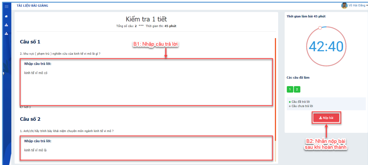
Hình 1: Làm bài kiểm tra